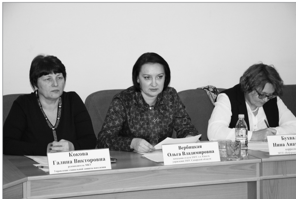
О социальной составляющей демографической политики говорили за «круглым столом» руководители служб. На укрепление института семьи направлены многочисленные акции, проводимые в городском округе.

КАК РЕАЛИЗУЕТСЯ В ГОРОДСКОМ ОКРУГЕ ДЕМОГРАФИЧЕСКАЯ ПОЛИТИКА В ДЕЯТЕЛЬНОСТИ И ВЗАИМОДЕЙСТВИИ ЦЕЛОГО РЯДА СЛУЖБ, РАССМОТРЕЛИ УЧАСТНИКИ «КРУГЛОГО СТОЛА»