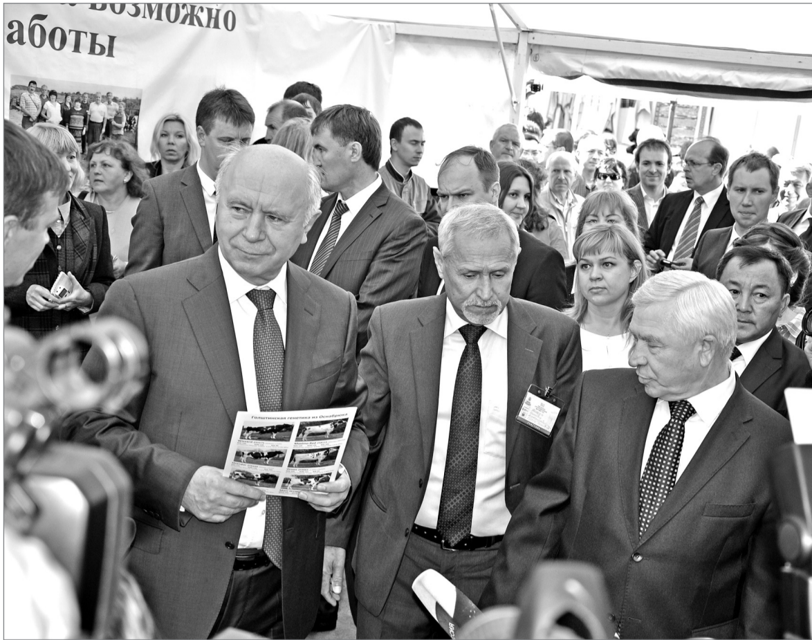
Во время посещения Поволжской агропромышленной выставки в сентябре этого года Губернатор Самарской области Николай Иванович Меркушкин подробно ознакомился с результатами деятельности государственного предприятия Самарской области Самарский центр развития животноводства «ВЕЛЕС».

По мнению главы региона, рост показателей в животноводстве обусловлен не только эффективной работой сельскохозяйственных организаций, но и развитием и укреплением малых форм хозяйствования и увеличением финансирования. «По объему средств, выделяемых из федерального бюджета на развитие семейных животноводческих ферм, наш регион находится на первом месте в стране», - говорит Николай Меркушкин и приводит конкретный пример: - За последние два года построены и реконструированы 159 молочных комплексов».