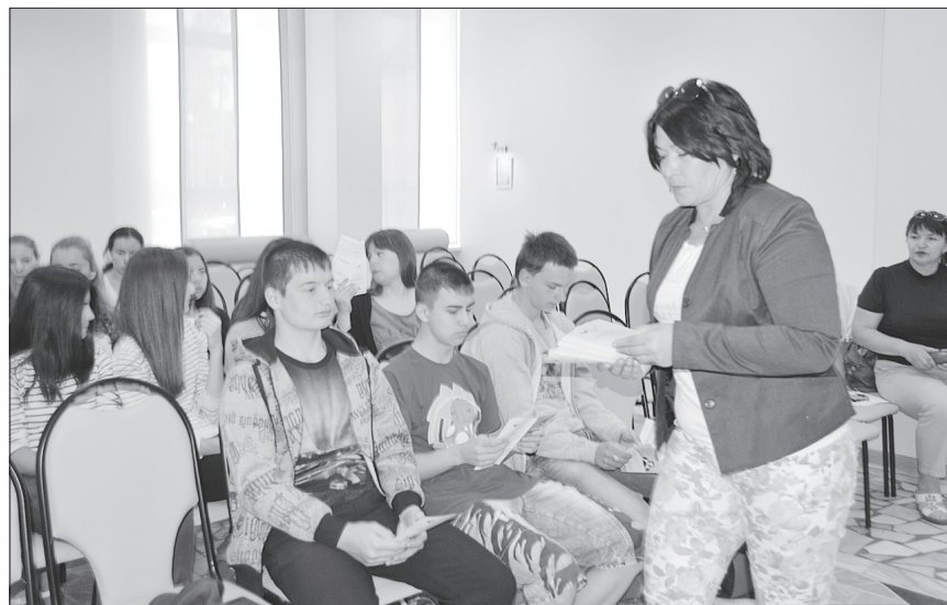
Специалисты кабинета профилактики Центральной больницы раздали подросткам познавательные памятки о вреде курения.