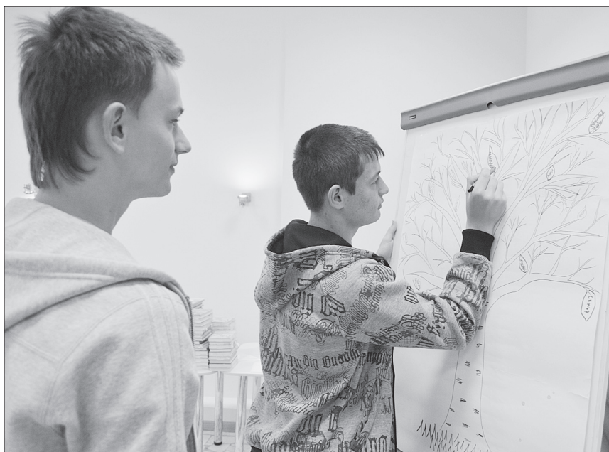
Жизнь без табака участники встречи выразили через своеобразное творчество.

Собственное видение плюсов некурящего человека ученики рисовали в виде зеленых листочков на дереве. И чем больше положительных моментов ребята находили в отказе от курения, тем все зеленее и «пышнее» становилось символизирующее нашу жизнь дерево. Как закрепили знания об отрицательных явлениях дурной привычки кинельские тинэйджеры, вопросами анкеты проверила специалист по работе