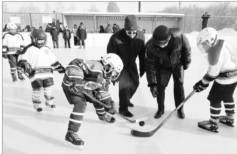
Борис Михайлов и Борис Майоров выполняют вбрасывание шайбы на детском хоккейном турнире в Кинеле. Январь 2017 года.

Владислав Третьяк, Борис Михайлов, Борис Майоров - звезды советского хоккея снова в Кинеле