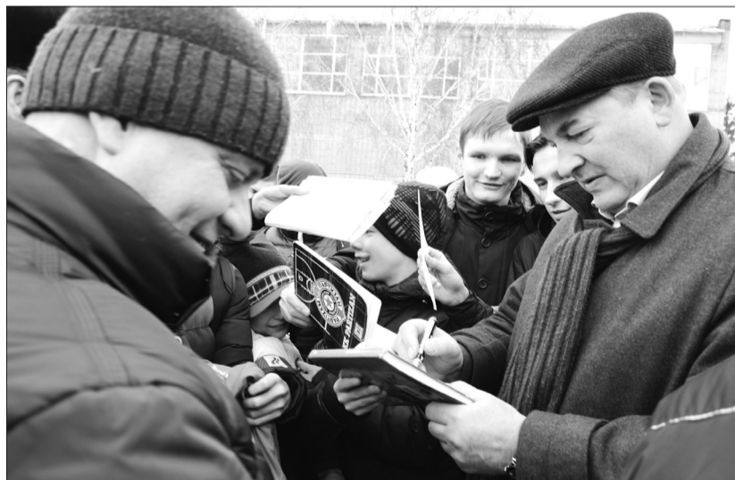
В 2016 году «Кубок Легенд» посетил Владислав Третьяк.

Легендарные хоккеисты, составляющие славу отечественного и мирового спорта, приезжают в наш городской округ, чтобы принять участие в турнире «Кубок Легенд». Эта замечательная традиция укрепилась в городском календаре. Уже в пятый раз с приглашением прославленных игроков сборной Советского Союза поселок Усть-Кинельский на один день станет хоккейной столицей области. Праздник спорта состоится 9 февраля.