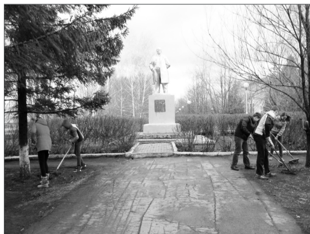
Учащиеся школы № 3 вышли на субботник для уборки парковой зоны у памятника Ленина.