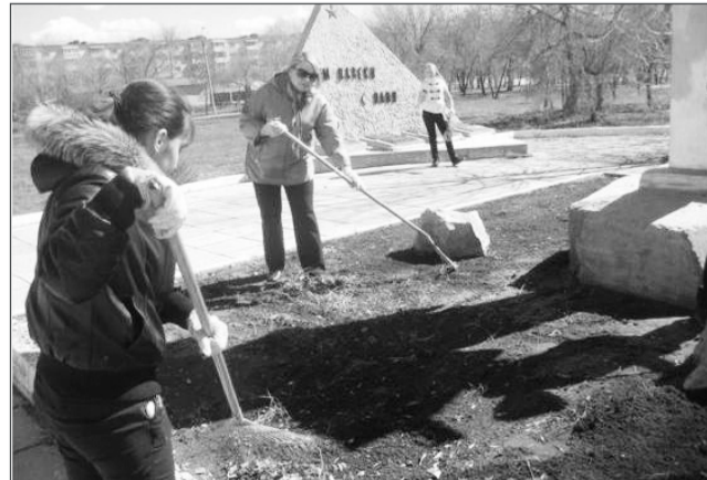
Волонтеры из школы № 9 приводили в порядок территорию обелиска в Детском парке.