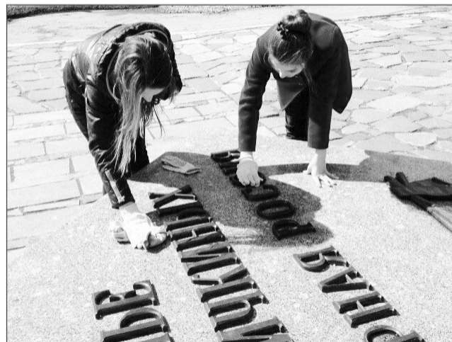
Старательно поработали ребята из алексеевской школы у монумента семьи Володичкиных.