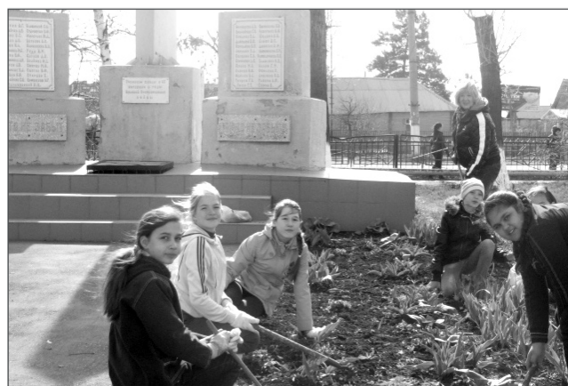
Ученики школы № 10 поработали на территории своего учреждения. Здесь установлен знак в память о погибших выпускниках школы.