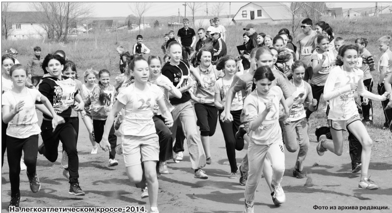
На легкоатлетическом кроссе-2014.

30 АПРЕЛЯ СОСТОИТСЯ ЛЕГКОАТЛЕТИЧЕСКИЙ КРОСС НА ПРИЗЫ ГОРОДСКОЙ ГАЗЕТЫ