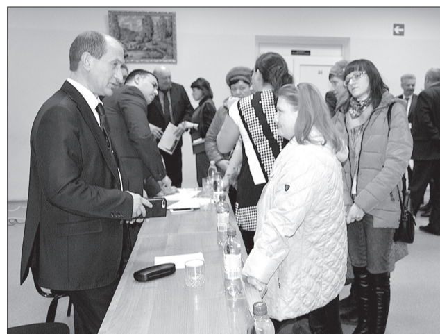
К руководителю муниципалитета в школе № 11 вопросов было много и в ходе разговора, и после встречи.

В течение последних двух недель по графику встречи на южной стороне Кинеля общественные собрания с участием главы городского округа прошли в Образовательном центре «Лидер», в школах № 10 и № 11, в Кинельском государственном техникуме. О чем говорил руководитель муниципалитета и какие вопросы задавали жители на встречах в «Лидере» и школе № 11, выслушали журналисты газеты.