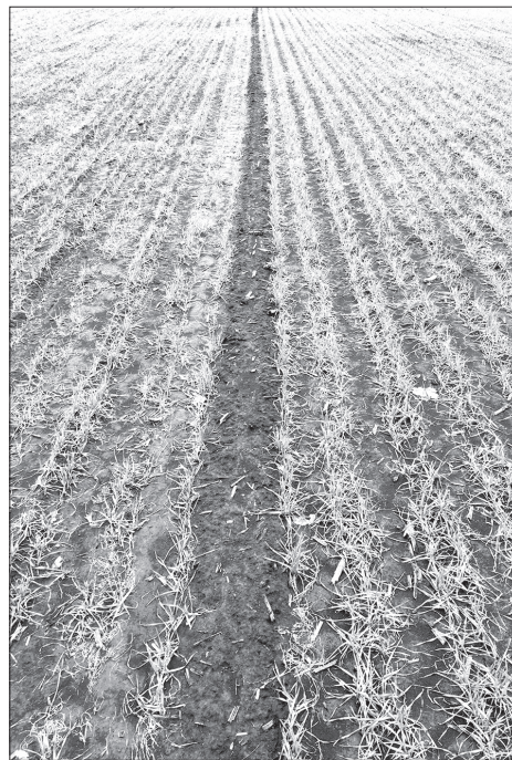
Вариант хозяйства СЕЛЕСТ МАКС (фунгицид + инсектицид)

Липецкая область. Озимая пшеница Скипетр. 4 апреля 2017. Выпады от снежной плесени на триазольном продукте составляют 35 %.