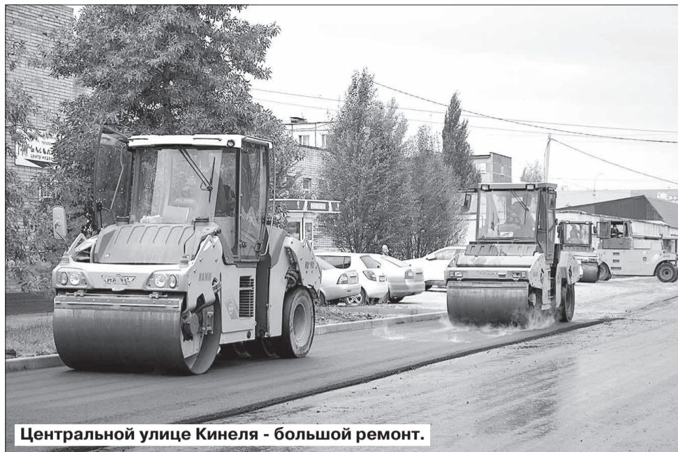
Центральной улице Кинеля - большой ремонт.