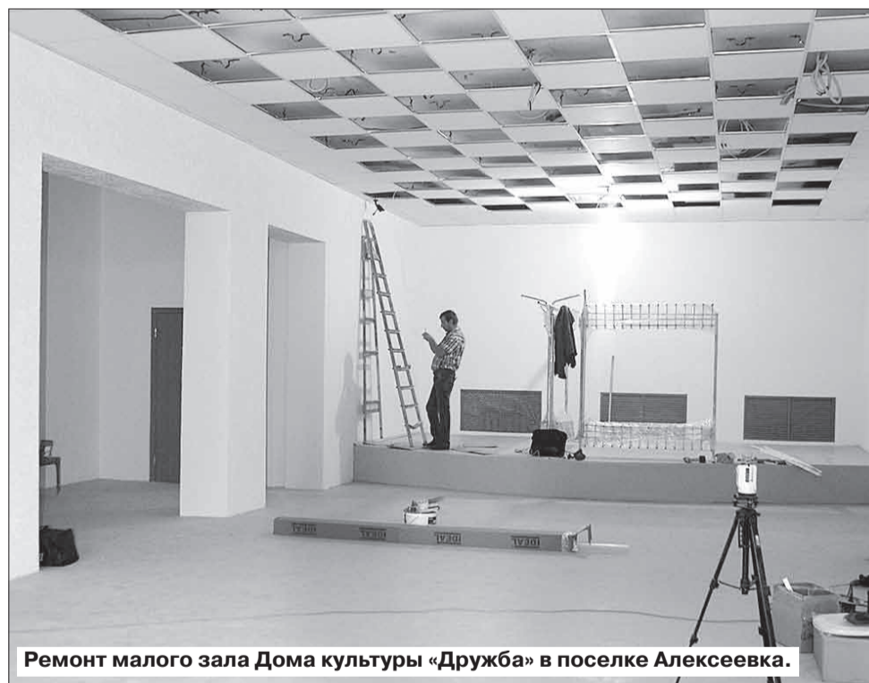
Ремонт малого зала Дома культуры «Дружба» в поселке Алексеевка.