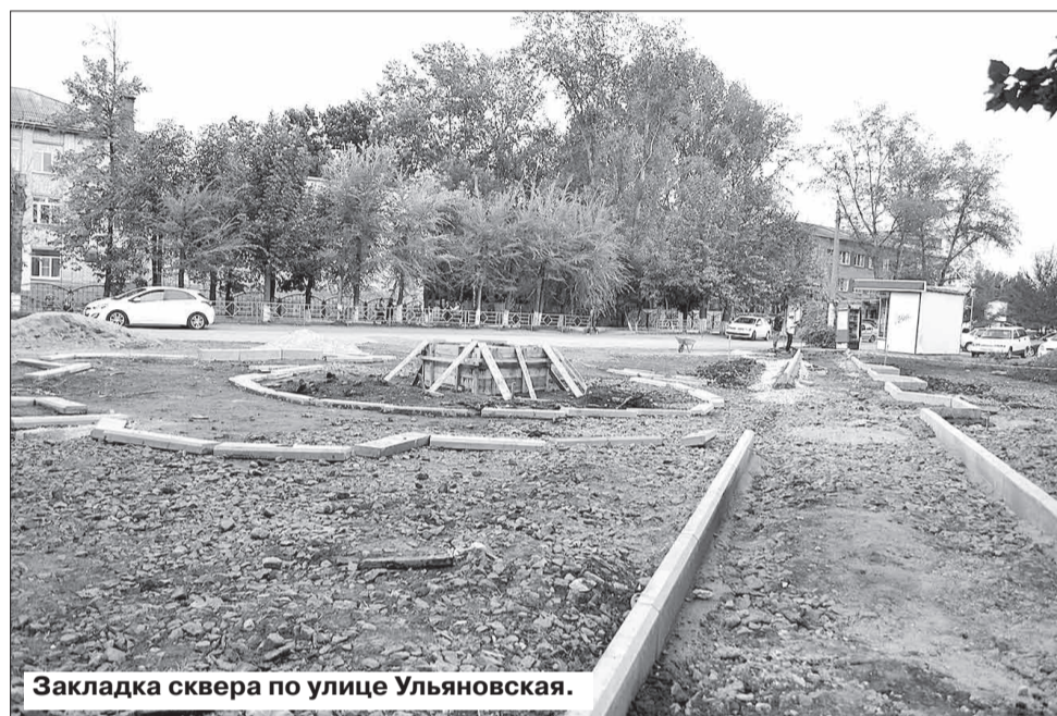
Закладка сквера по улице Ульяновская.