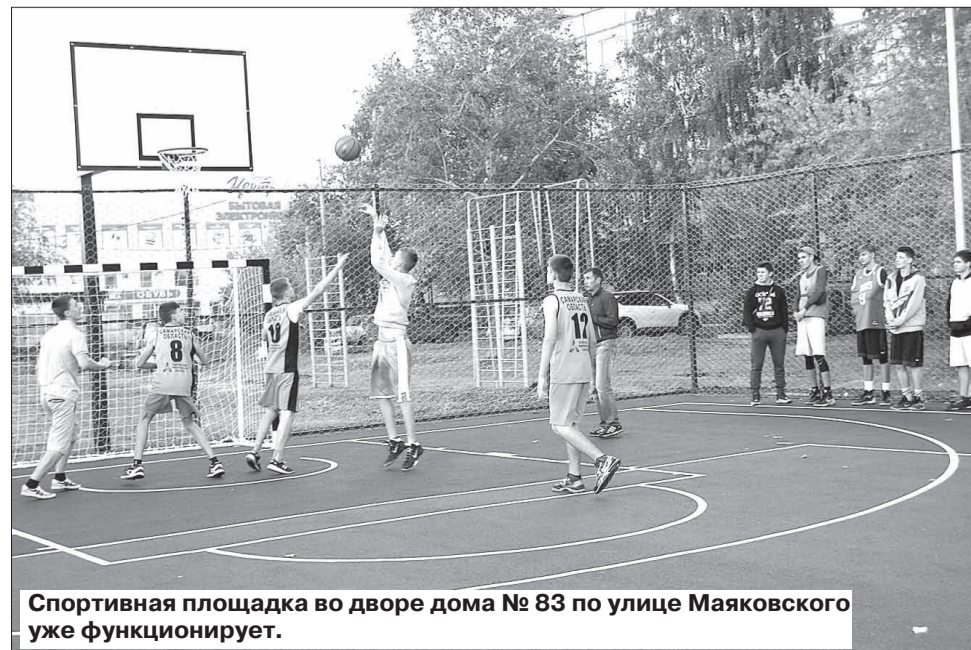
Спортивная площадка во дворе дома № 83 по улице Маяковского уже функционирует.