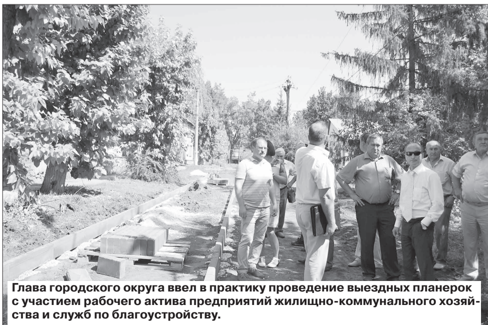
Глава городского округа ввел в практику проведение выездных планерок с участием рабочего актива предприятий жилищно-коммунального хозяйства и служб по благоустройству.