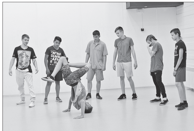
Ребята отрабатывают предстоящее выступление.

Фестиваль объединит многие направления молодежной субкультуры: современная хореография и рэп, фотография и граффити, диджеинг и кибер-спорт. Цель фестиваля - содействие созидательной активности талантливой молодежи и ее самореализации, поддержка творческих молодежных сообществ.