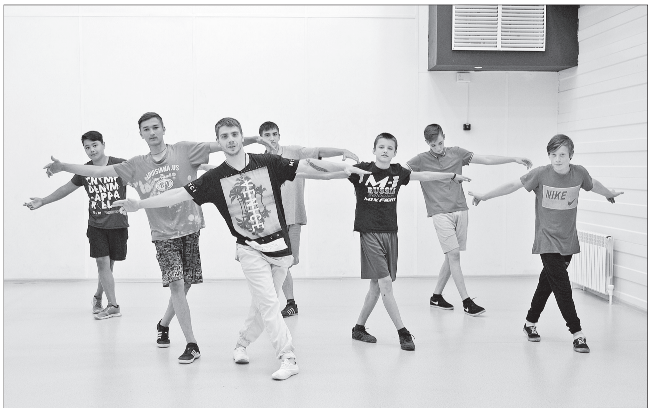
Участники кинельской команды проводят репетиции каждый день.

В Кинеле пройдет первый областной фестиваль молодежных субкультур