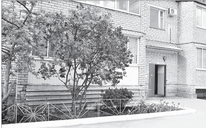
Когда управляющей компании и жителям удастся достичь взаимопонимания и совместного участия в решении коммунальных вопросов - в домах и дворах становится уютнее.

Покрытые рубероидом, мягкие кровли воду пропускали, как через решето. На многих крышах ремонтировать приходилось до 100 квадратных метров одновременно. Вода в подвалах присутствовала практически в каждом доме. Постепенно худые водопроводные и канализационные трубы заменили, тогда и подвальные помещения стали сухими, рассадников комаров, сырости и застойных запахов не стало. Как вспоминают рабочие, да и сам руководитель компании, в иных подвалах вода стояла до слуховых окон. А в отдельных зданиях, где при строительстве значительно сэкономили на подвальных помещениях, к худым инженерным коммуникаци-