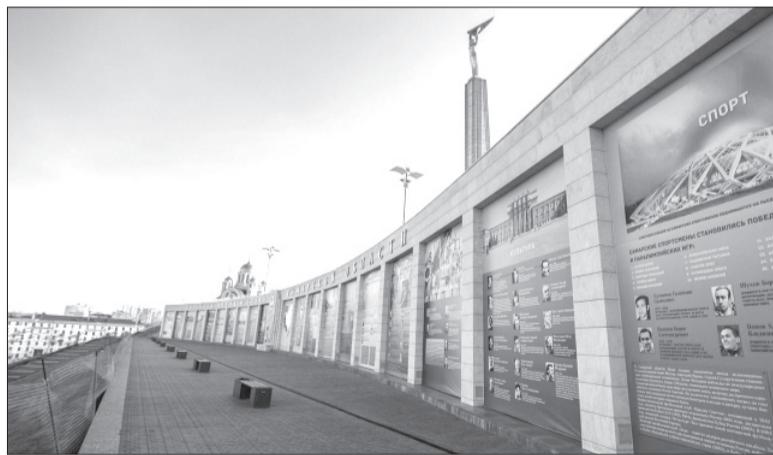
На мемориальном комплексе «Гордость, честь и слава Самарской области» будут проведены дополнительные работы.

Говоря о реконструкции знаковых мест Самары в рамках подготовки к Чемпионату мира по футболу, губернатор заверил: объекты, имеющие историческую ценность, будут сохранены. А шумиха, порой поднимаемая в блогосфере, не имеет под собой никаких оснований.