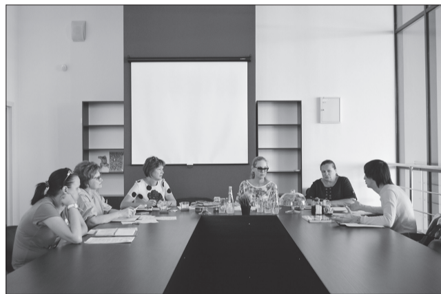
Организаторы фестиваля обсудили большой круг вопросов - от расположения площадок до состава жюри.