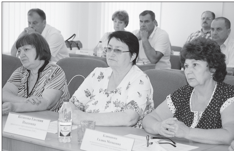
Заключительное заседание Общественного совета было совместным с депутатской комиссией Думы.

Первоначально договоры по проведению капитального ремонта был заключены в июне 2014 года с подрядчиком ООО «СКБ Холдинг». Срок исполнения договоров - 142 ка-