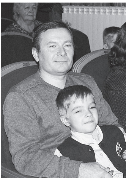
Рядом с папой так хорошо!

Михайлович сделал акцент на роли мужчины-воспитателя: строгого, внимательного и справедливого.