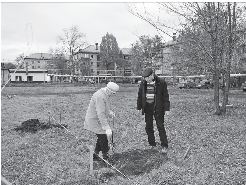
Жители дома № 108 по улице 50 лет Октября определяли места для новых саженцев.

вой территории заняли свое место саженцы тополя черного и каштана.