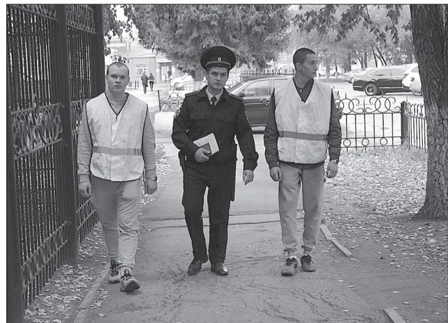
Участковые полиции в составе ДНД выходят на патрулирование городских улиц.

Награды вручены Главным управлением МВД России по Самарской области.