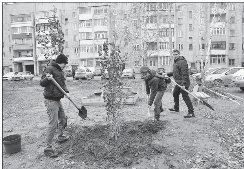
Участие в осеннем озеленении двора домов № 3 «а» и № 3 «б» по улице Фестивальная было коллективным.