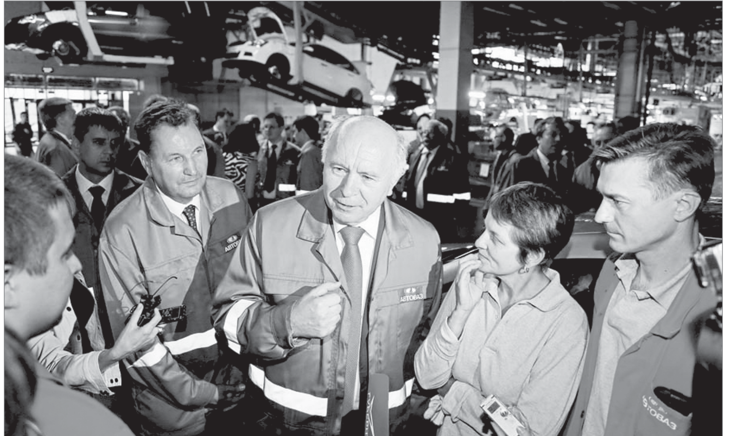
За два года своей работы на посту Губернатора Самарской области Николай Иванович Меркушкин около семидесяти раз приезжал в Тольятти, бился за АвтоВАЗ, создавал Особую Экономическую Зону с перспективой создания 20 тысяч новых рабочих мест.

Да если бы так... На самом деле любой нормальный человек понимает: все делается невероятным напряжением сил, на больших нервах, огромной ответственности, тщательной подготовке. Не могу даже сказать, не знаю, сколько было у Николая Ивановича перед совещанием предварительных рабочих встреч, с подробным анализом, расчетами, обоснованием, аргументацией «за» и «против» - с федеральными ми-