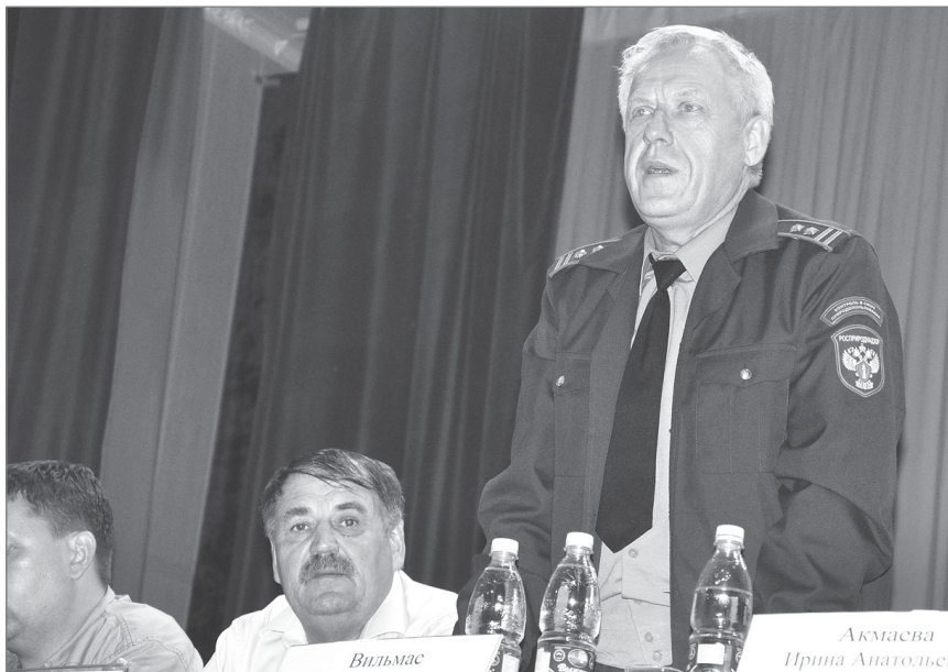
В обсуждении вопроса принял участие представитель Управления Росприроднадзора по Самарской области.

Поэтому муниципалитет для решения указанной проблемы обращался в ряд различных инстанций: в министерство лесного хозяйства, охраны окружающей