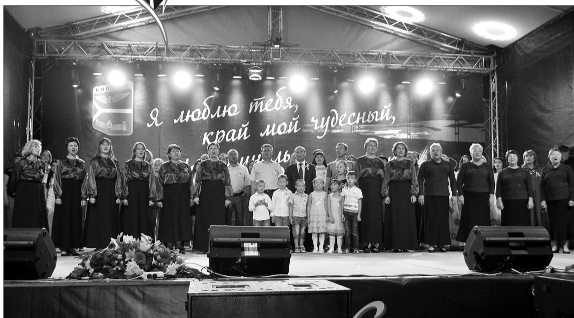
«Наш Кинель, ты - красивый и сильный - в самом сердце самарских земель», - вместе с хором на сцене гимн пела площадь.