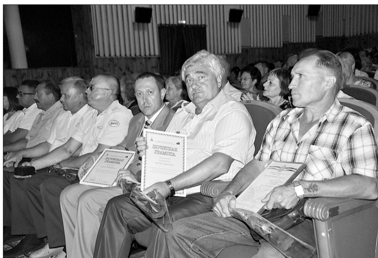
В первом ряду - работники Кинельского железнодорожного узла.