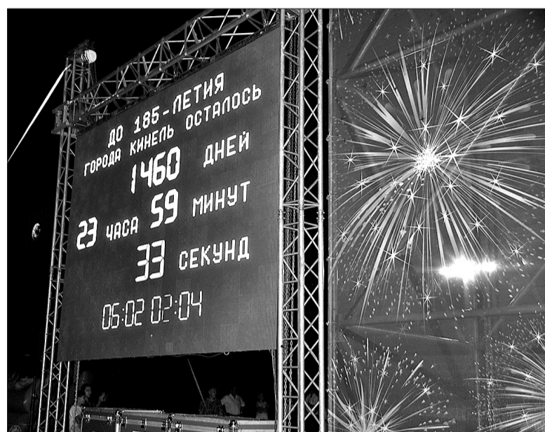
Шагаем к следующему юбилею родного города. Обратный отсчет времени дан!

Праздничный наряд августовского торжества раскинулся не только на площади Мира. Пешеходная зона по улице Маяковско-го была отдана молодежи, подрастающему поколению. Горожане плотным кольцом обступили площадку, где можно было помериться силушкой богатырской: вместо гири и штанги организаторы предлагали потягать тренажеры помощнее. Спортивный клуб единоборств «Пересвет» разложил татами прямо на улице, и трудно было определить, кого здесь больше - воспитанников этого объединения, выходивших с показательными выступлениями, или взрослых, наблюдавших, как юные спортсмены выходят на поединки.