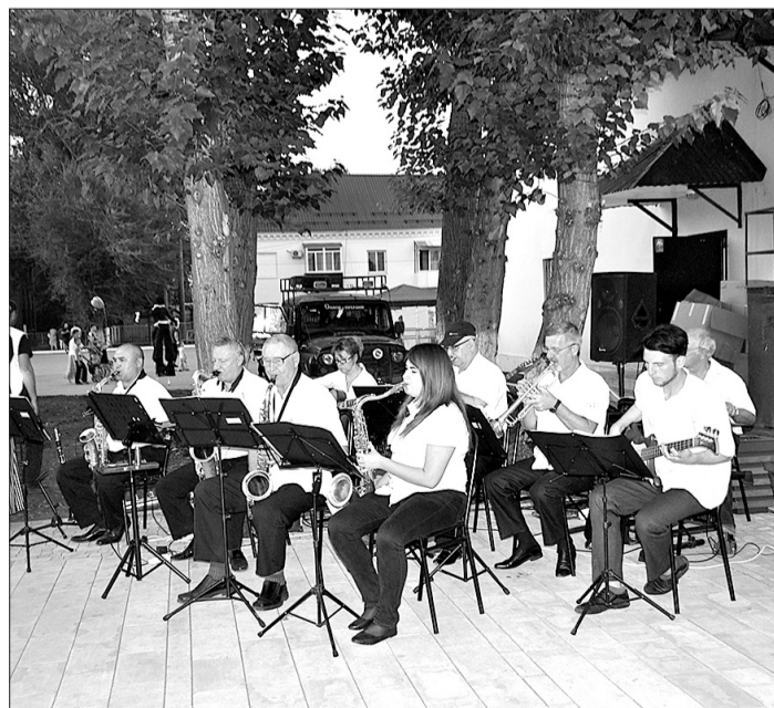
Музыканты оркестра «Джайв бенд» Городского Дома культуры умеют придать атмосфере торжества особенное звучание.