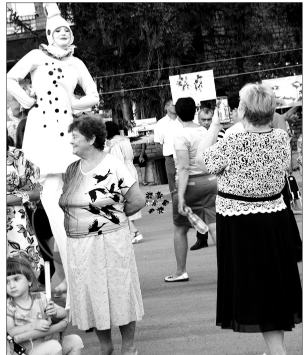
Мимы на ходулях веселили горожан и фотографировались с огромным удовольствием.