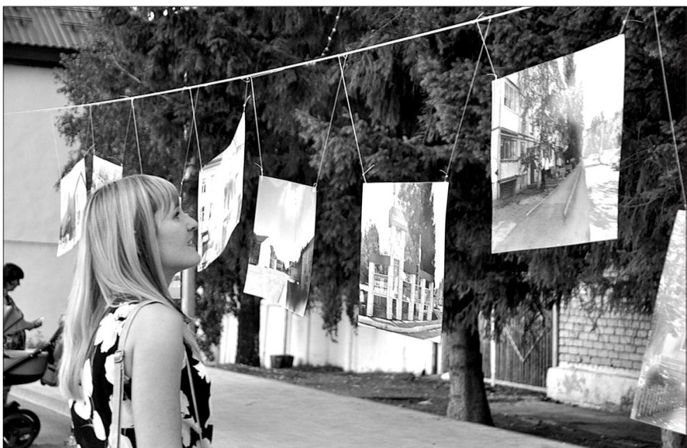
Узнать город в прошлом и увидеть его в настоящем. Фотогалерея никого не оставила равнодушным.