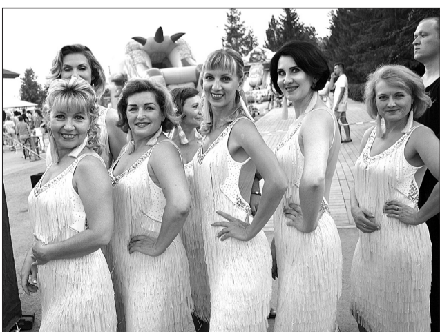
Своим выступлением группа «Синьоры» танцевально-спортивного клуба «Пульсар» всегда украшает концертную программу Дня города. «Мы рады возможности приподнести свой подарок Кинелю», - признались участники группы перед выходом на сцену.