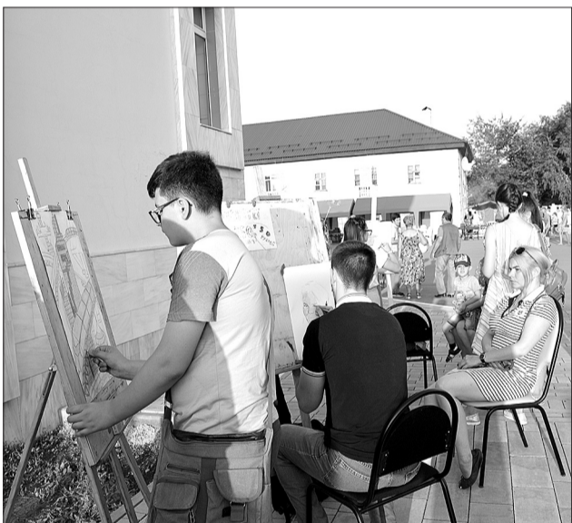
Рисуем праздничное настроение! Творческая идея с мольбертами прекрасно вписалась в общую палитру торжества.