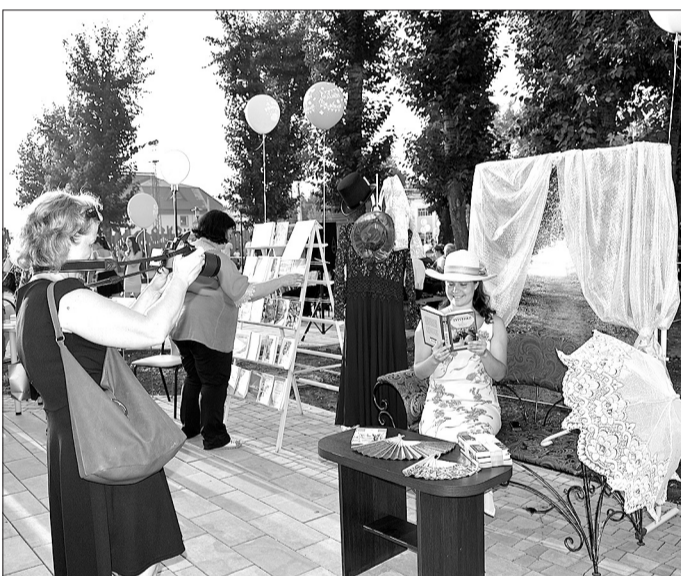
Ажурный зонтик, веер, интересная книга и пейзаж в импровизированном окне. Такую фото-зону создали библиотекари.