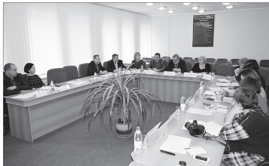
На заседании «круглого стола» депутаты проанализировали, как реализация муниципальной программы способствует решению проблемы.

Кинельская Дума продолжает практику проведения «круглых столов» по актуальным вопросам социальной политики и экономического развития муниципалитета. На очередной встрече в таком формате с участием руководителей структурных подразделений администрации, представителей общественности депутаты обсудили существующие проблемы в создании безбарьерной среды на территории городского округа.