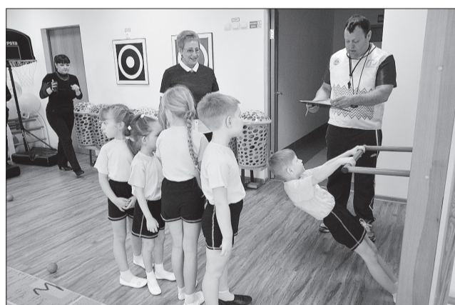
Взрослые подбадривали дошкольников на этапах ГТО.