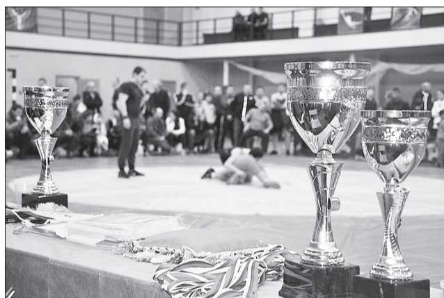
Число участников большого турнира растет каждый год.

Впервые для городского округа в сдаче нормативов ГТО приняли участие воспитанники детского сада, а на Всероссийском турнире кинельские борцы вольного стиля завоевали 11 медалей различного достоинства