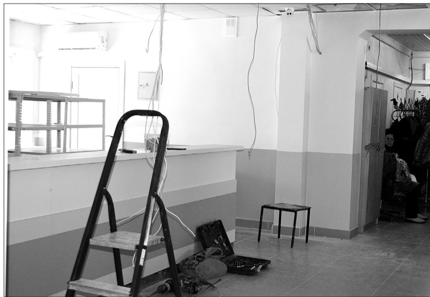
На месте прежней регистратуры оборудовано современное пространство для приема посетителей кинельской больницы. Основные работы здесь уже выполнены.

«Бережливая поликлиника» - это федеральный проект. Его реализация - процесс многоэтапный, включающий в себя и проведение проектно-сметных работ, и ремонт некоторых помещений поликлиники, и внедрение современных информационных продуктов, и установку электронной техники, обеспечение эргономичным оборудованием рабочих мест регистраторов, проведение работ по снижению времени ожидания пациентами, - рассказал газете главный врач Кинельской центральной