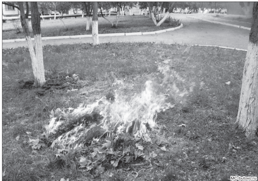
Сжигание травы создает пожароопасную ситуацию.

- установите у каждого строения емкость с водой, приставные лестницы, достигающие крыши. На кровле необходимо иметь лестницу, доходящую до конька крыши; - запрещается разведение костров, проведение пожароопасных работ в весенне-летний период в условиях устойчивой сухой, жаркой и ветреной погоды; - не оставляйте брошенными на улице бутылки, битые стекла, которые, превращаясь на солнце в линзу, концентрируют солнечные лучи до спонтанного возгорания находящихся под такими предметами травы;