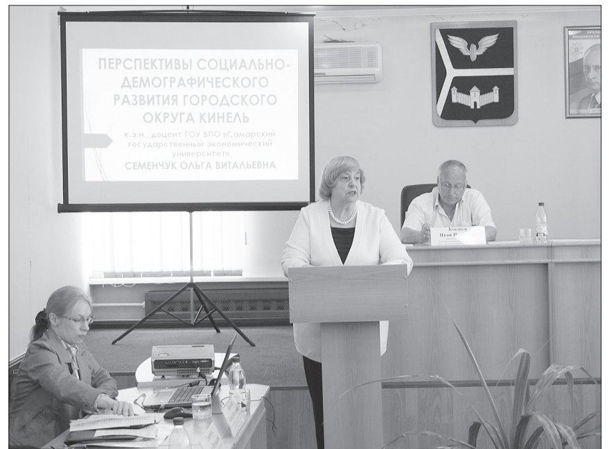
В обсуждении проекта Стратегии, который представили специалисты Самарского экономического университета, приняли участие депутаты, сотрудники администрации и общественники.

При этом, по словам доцента кафедры региональной экономики, государственного и муниципального управления экономического университета, кандидата эконо-