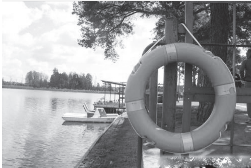
Наслаждаясь долгожданным отдыхом у воды, нельзя забывать о правильном поведении на водоеме.

4. Соблюдайте правила пользования лодками и другими пла-