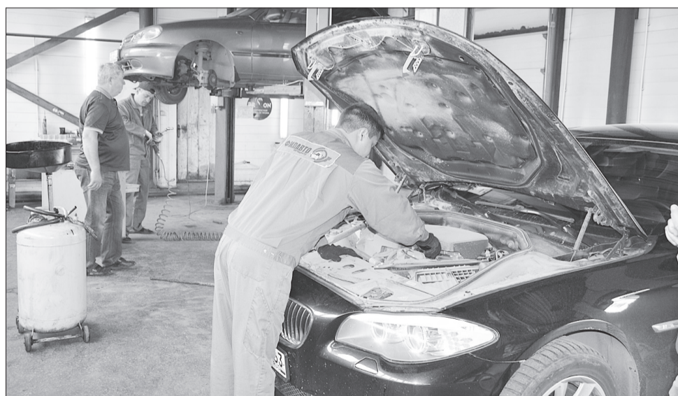
В автомастерских работы всегда достаточно.

стоялось. А так, мальчишки на этом выросли, с детства со мной на ремонте. Вместе до винтика собственную «Ауди» перебирали».