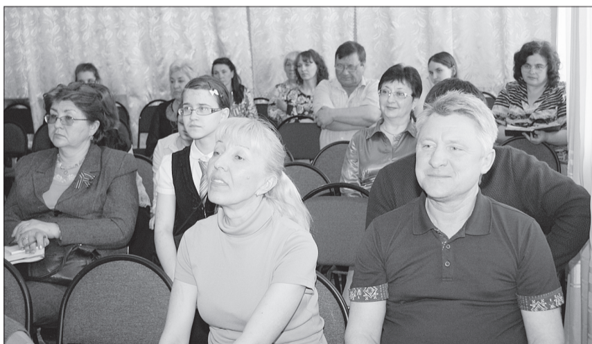
Преподаватели музыкальных школ и школ искусств были внимательными слушателями на встрече.

В мастер-классе также приняли участие ученики музыкальных школ, играющие на фортепиано и занимающиеся вокалом.