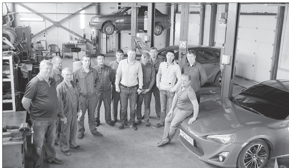
Коллектив ООО «Филавто».