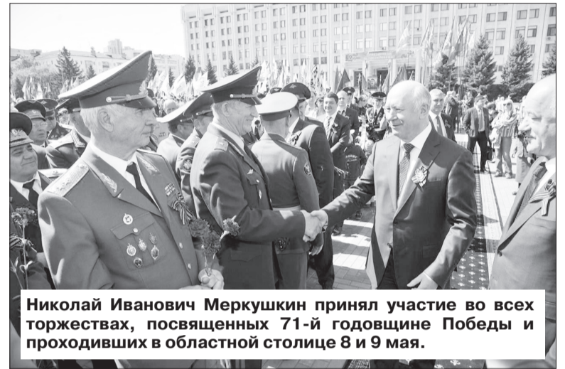
Николай Иванович Меркушкин принял участие во всех торжествах, посвященных 71-й годовщине Победы и проходивших в областной столице 8 и 9 мая.

«По сосредоточению отраслей экономики Самарской области нет равных в России».