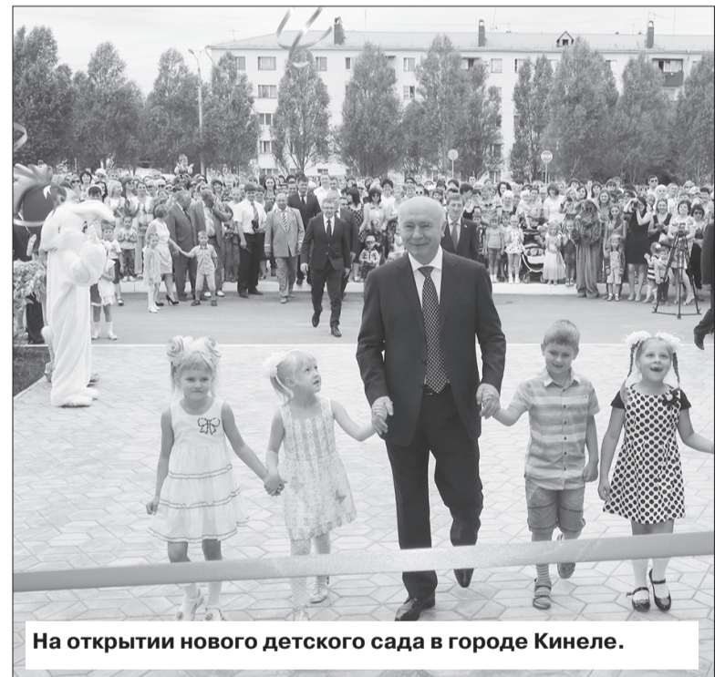
На открытии нового детского сада в городе Кинеле.

«Подлинная элита Самарской области - это мощный директорский корпус крупных предприятий, ректоры вузов, ученые, генералитет, ветераны, общественные организации, интеллигенция».