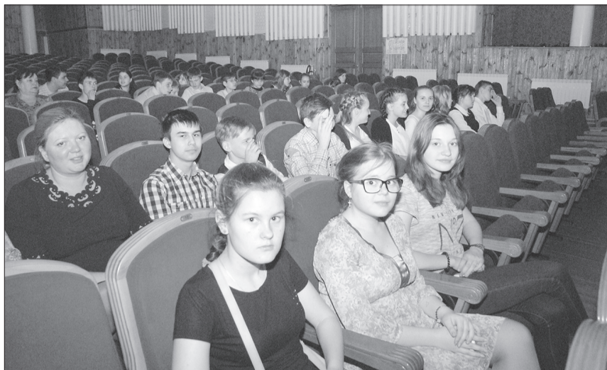
Ребята приняли заинтересованное участие в разговоре. Вопросов режиссеру задали немало.

В Кинеле документальные фильмы заслуженного деятеля искусств