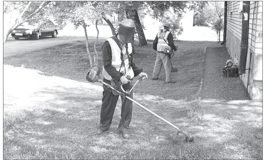
На первый обкос травы вышли работники управляющей компании «Евгриф».

При технической возможности ведутся работы по восстановлению уличного освещения, но есть проблема - на старые образцы светильников уже не выпускаются запчасти. Следующий этап работ - обрезка веток деревьев, мешающих линиям и создающих аварийную ситуацию.