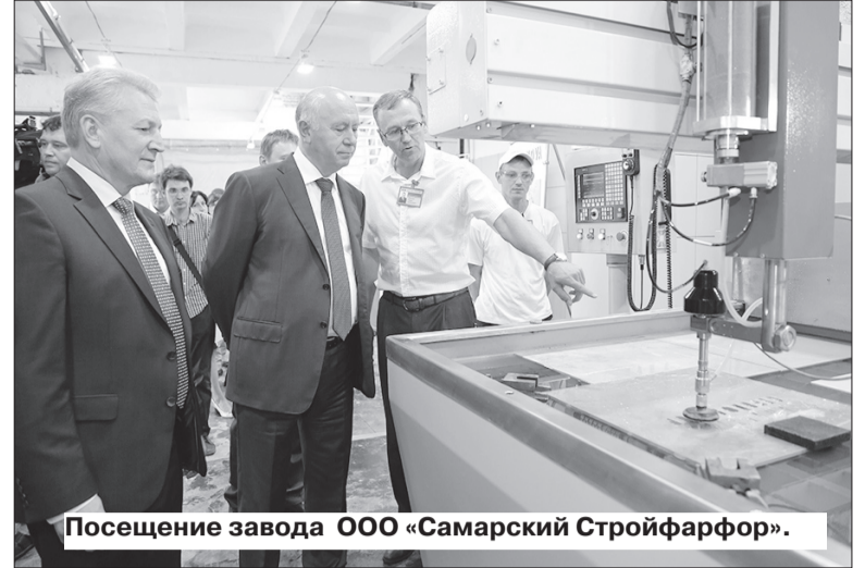
Посещение завода ООО «Самарский Стройфарфор».

Конечно, эти итоги работы в Мордовии добавляют признания самарских людей, придают сил и уверенности в том, что даже самые сложные проблемы в Самарской области разрешимы.