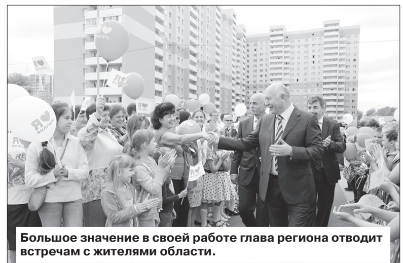
Большое значение в своей работе глава региона отводит встречам с жителями области.

«За четыре года в области построено 6 новых общеобразовательных школ, 57 детских садов».