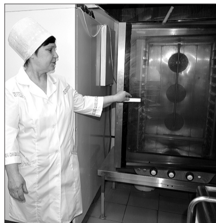
Пароконвекционная печь для вкуснейшей выпечки.