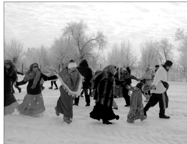
Алексеевские казаки отметили Масленицу обрядами и обычаями, что издавна проводились на Руси.

Еще одной необычной участницей гуляний на площадке «Реацентра» стала ростовская кукла, которую привезли на праздник гости из Безенчука. Союз предпринимателей Безенчукского района поддерживает сотрудничество с Алексеевским станичным обществом. В этом году безенчукцы приехали с самоваром и со сладким подарком: огромный торт разделили на всех участников широкой Масленицы. Не обошлось и без традиционных лакомств: блинов, горячего чая, дымящейся каши с маслом. Угощения, как и призы для победителей конкурсов, предоставил Самарский «Реацентр».