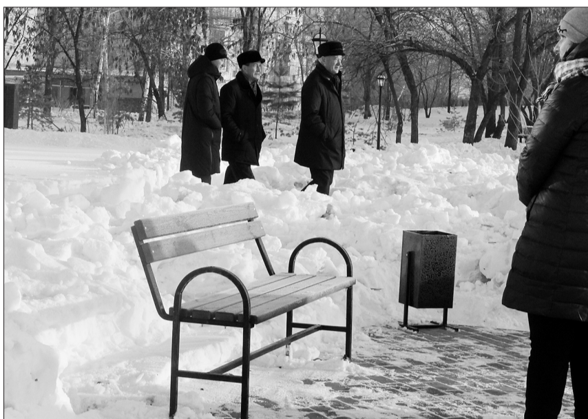
Законченный благоустроенный вид скверу в Алексеевке придадут весной. Здесь проведут работы по озеленению новой зоны отдыха поселка.

Еще один адрес на улице Маяковского вошел в маршрут визита областных парламентариев. На территории дворов домов № 81 и № 83 спортивная площадка с ограждением была установлена в 2016 году, она функционирует. Здесь, кстати, депутаты посчитали не лишним посмотреть и на работу управляющей компании «Евгриф».