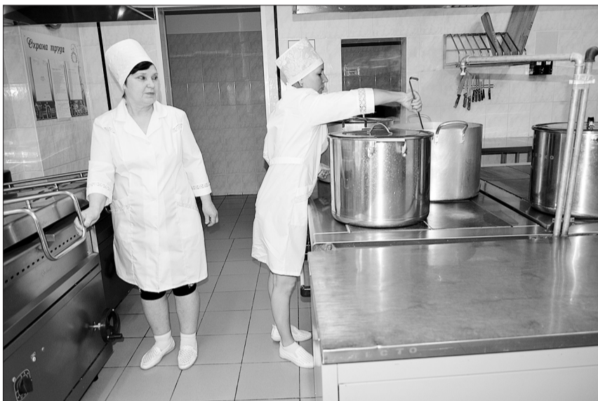
Точно по расписанию на кухне детского сада должны быть приготовлены завтраки, обеды, полдники и ужины.