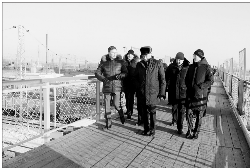
Вопросы технической модернизации мостового сооружения обсуждали на «высоте».

На тот момент строительная бригада, закончив ремонт в первом подъезде дома № 81, приступила к работам во втором. При перечне работ особый акцент был сделан на установке датчиков движения по освещению лестничных площадок, позволяющих экономить на расходах общей электроэнергии.