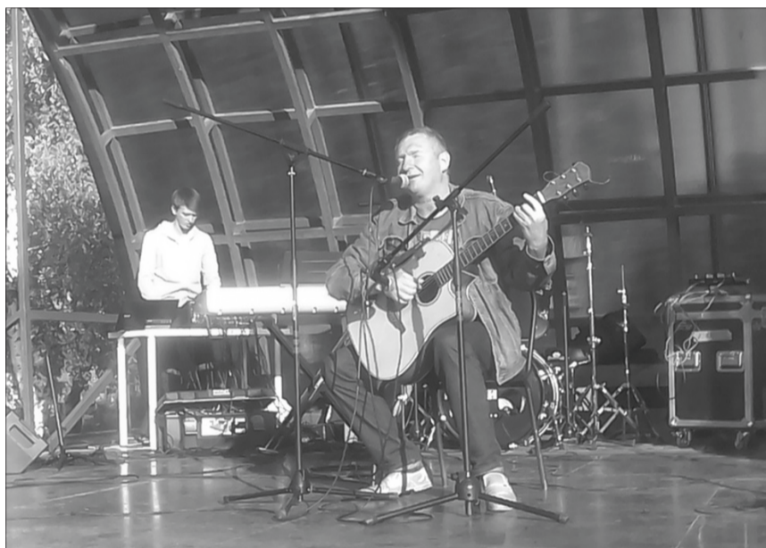
Песни Вячеслава Соловьева о том, что близко и дорого каждому.

И еще одна отсылка к, пожалуй, главному событию гитарной музыки и бардовской песни в нашей стране - Грушинскому фестивалю. На сцене слово было дано представителем музея Валерия Грушина - Ирине Тибушкиной и Тамаре Муравьевой. Они исполнили несколько музыкальных композиций, в том числе, тех, которые звучали от самого Валерия Грушина. Рассказали малоизвестные факты из биографии этого человека. Оказывается, Грушин не раз бывал в Алексеевке, восторгался красотой природы и богатой историей поселка. «Нам