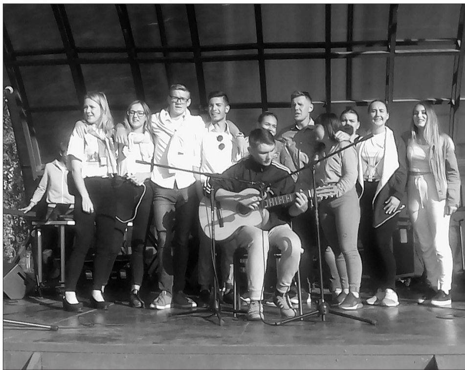
Командное творческое выступление Молодежного совета поселка Алексеевка. Это был первый выход ребят в качестве исполнителей, и у них получилось.

Украшением праздничной программы Дня поселка стал полюбившийся Алексеевцам фестиваль бардовской песни и гитарной музыки «Алексеевские гитары». Своё творчество подарили как уже известные жителям музыканты, так и исполнители, которые впервые вышли на фестивальную сцену. В концертной программе выступили коллективы с других территорий области. Так что «Алексеевские гитары» неофициально получили статус межмуниципального музыкального, песенного фестиваля.