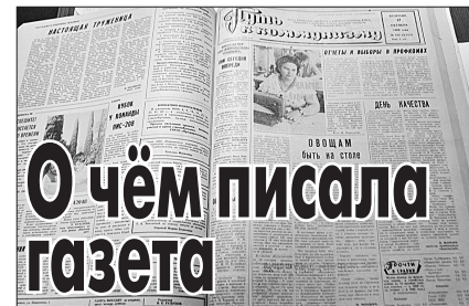
«Путь к коммунизму», 28 марта 1989 года