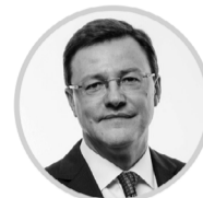
ДМИТРИЙ АЗАРОВ, губернатор Самарской области

« Квалифицированные кадры нужны региону. Особенно – промышленным предприятиям. Наши учебные заведения СПО и высшего образования успешно решают эту задачу »