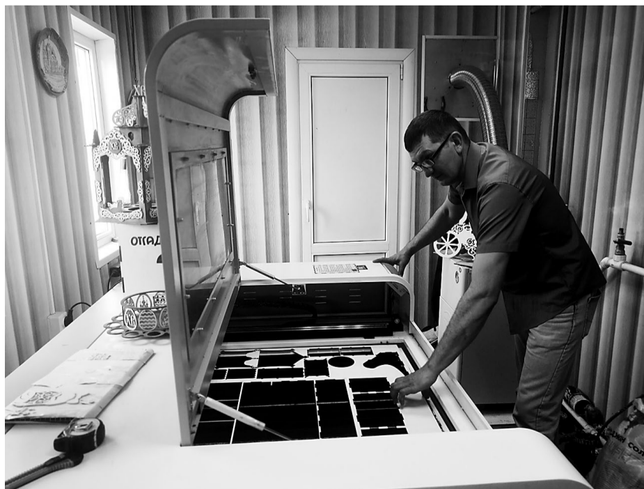
Лазерный станок с программным обеспечением способен вырезать изделия любой сложности.

Ассортимент изделий разнообразный. Вот фанерная коробочка с прозрачными оконцами разделена отделениями для разных сухофруктов - достойно смотрится и предотвращает продукты от усыхания.