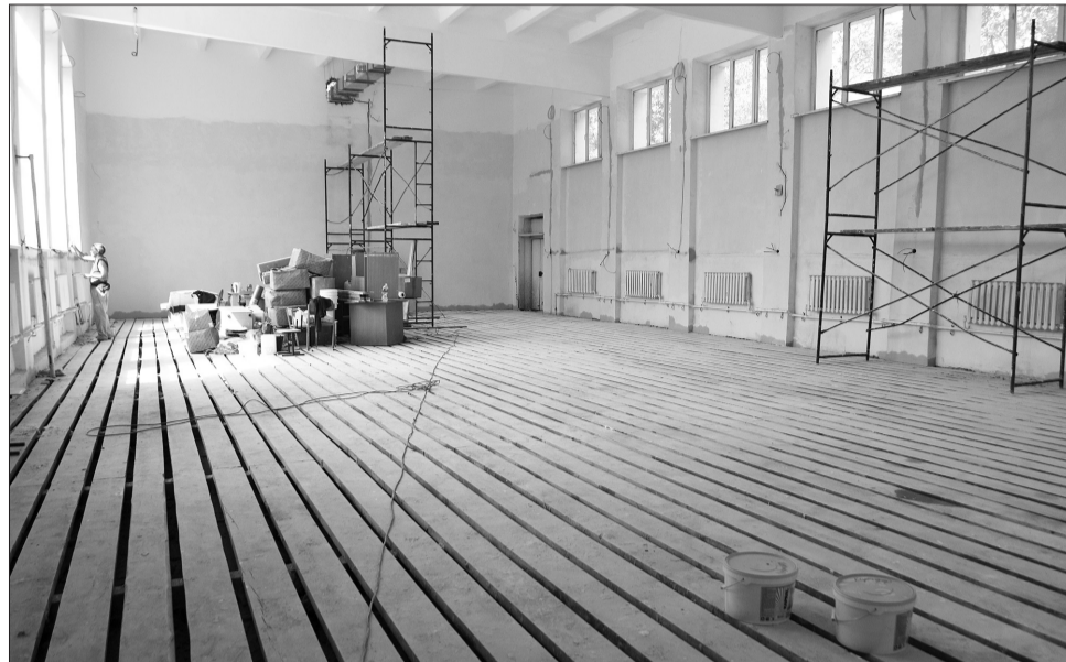
В новом спортзале ученикам заниматься будет интересно и комфортно.

Второй этап масштабного ремонта школы затронет внешний облик здания. Ремонтники полностью обновят кровлю, выполнят теплоизоляцию стен и последующую их отделку. Фасад приобретет современный стиль благодаря использованию декоративной штукатурки светлого бежевого оттенка в сочетании с темным цоколем. В рамках второго этапа капитального ремонта