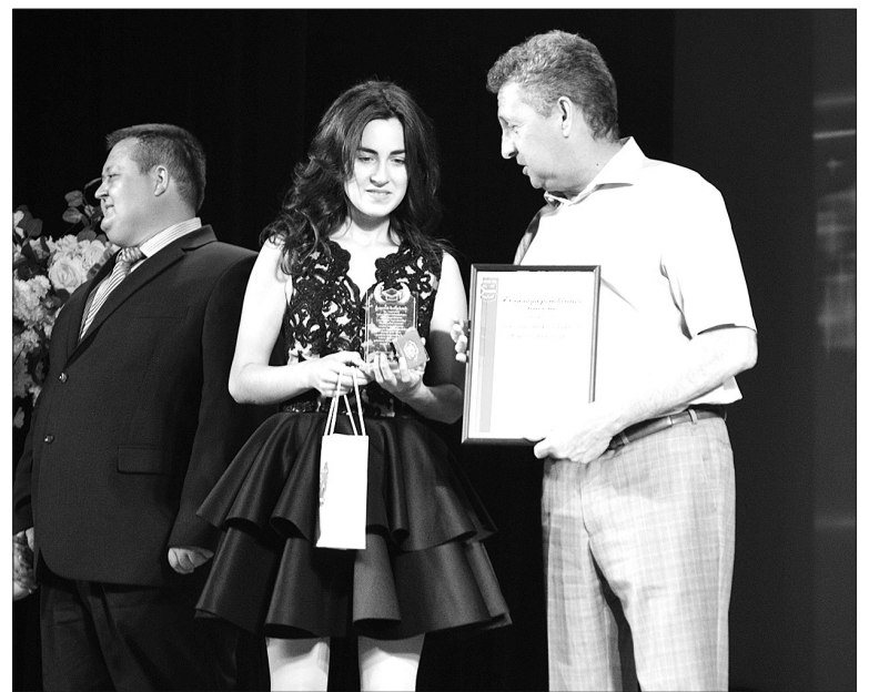
Как молодость прекрасна! Пусть у них обязательно все получится.