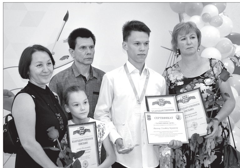
На церемонии награждения участников конкурса «Талантливые дети» наш герой вместе с родителями и классным руководителем.

«Перед соревнованиями нам удалось пообщаться с человеком-легендой - Михаилом Тимофеевичем Калашниковым. И, знаете, удивило, насколько этот великий человек был открытым, дружелюбным. Тогда он сказал: «Ребята, запомните: убивает не автомат,