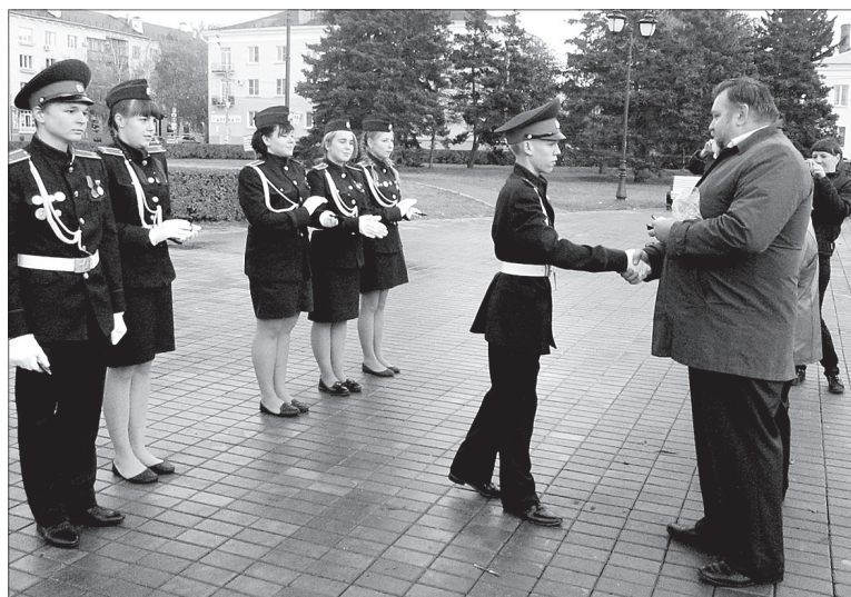
Активное участие курсанта в военно-патриотических мероприятиях отмечено знаком «Часовой памяти».

В дни летних каникул командир и его отряд готовятся к августовской «Боевой кругосветке». В программу ответственных соревнований войдут прыжки с парашютом, рукопашный бой, спортивное ориентирование и другие дисциплины, которые каждый курсант должен знать на отлично.