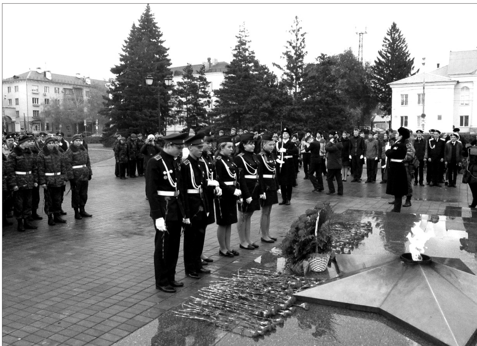
У Вечного огня курсанты клуба «Патриот ДОСААФ». Ребята принимают постоянное и активное участие в мероприятиях патриотической направленности, проходящих в городах и районах Самарской области.

ДЕСЯТИЛЕТИЕ СВОЕЙ ДЕЯТЕЛЬНОСТИ ОТМЕТИЛ В ЭТОМ ГОДУ КЛУБ «ПАТРИОТ ДОСААФ» - ОДНО ИЗ ПЕРВЫХ ВОЕННО-ПАТРИОТИЧЕСКИХ ОБЪЕДИНЕНИЙ, СОЗДАНЫХ В ГОРОДСКОМ ОКРУГЕ