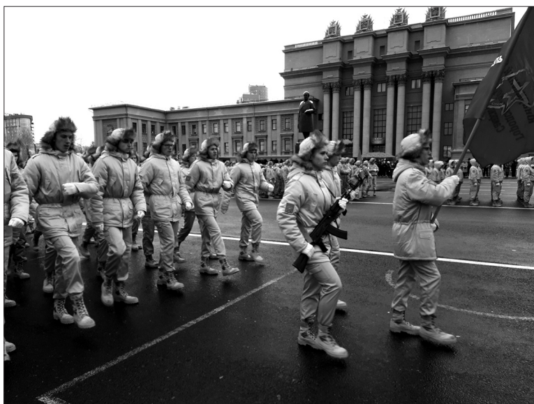
Двадцать три воспитанника объединения в этом году прошли торжественным маршем на Параде Памяти по площади Куйбышева.

Татьяна ДАВИДОВА.