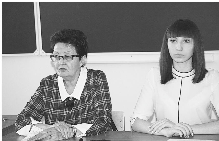
Знать историю родного города - главный посыл парламентских уроков.