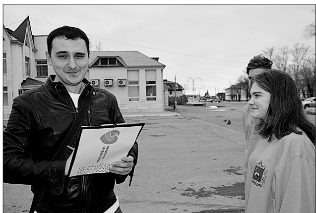
Кинельцы в ходе опроса, проводимого в рамках проекта, высказали свои пожелания при составлении городской культурной программы на летние месяцы.

Жителям предлагалось ответить на вопросы о том, как и где им хотелось бы проводить свой досуг, какой формат мероприятий им наиболее интересен, какие мероприятия они хотели бы посетить в своем городе или поселке.