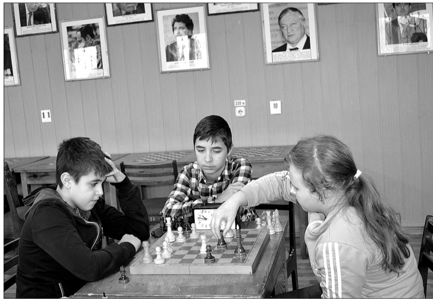
Юные кинельские шахматисты сыграли товарищеские партии перед серьезным турниром.

Если в первом турнире команды были смешанными, в состав входили 4 юноши и 1 девушка, то в этот раз решено провести в рамках спортивного мероприятия отдельно соревнования среди команд девушек и среди команд юношей.