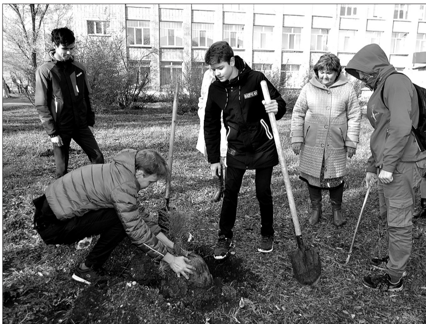
На просторном участке школы № 4 зазеленеют сосны и кедры. Старшеклассники обещают хвойный «наряд» школьного парка сохранить.

Но для сегодняшних школьников символичность таких акций еще и в другом. «Пройдут годы, мы приведем в школу своих детей и обязательно покажем им деревья,