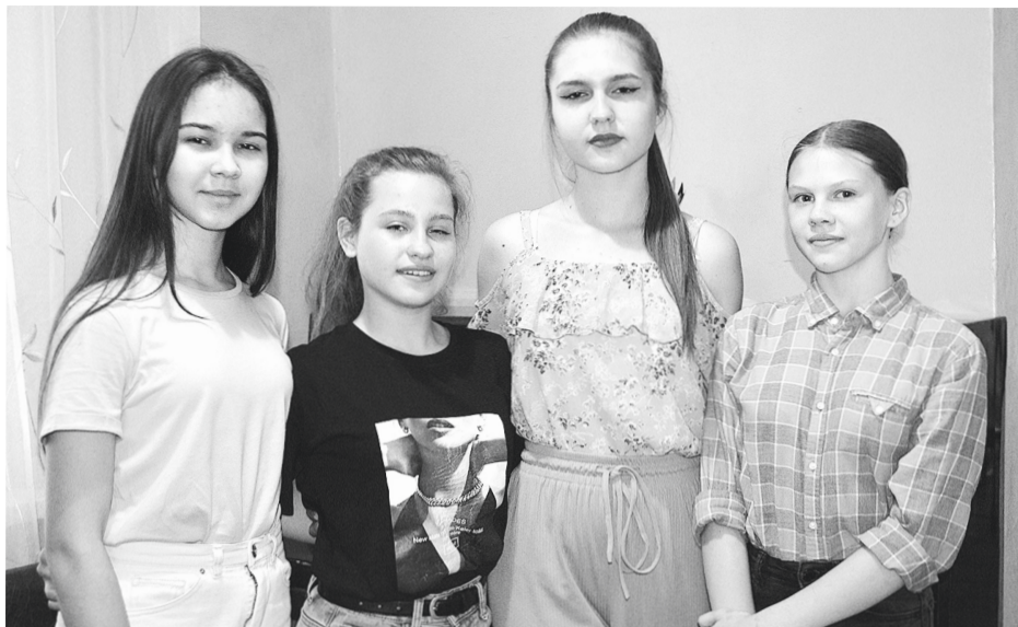
Участницы коллектива в беседе с корреспондентом газеты поделились впечатлениями о важном в их творческой биографии конкурсе.