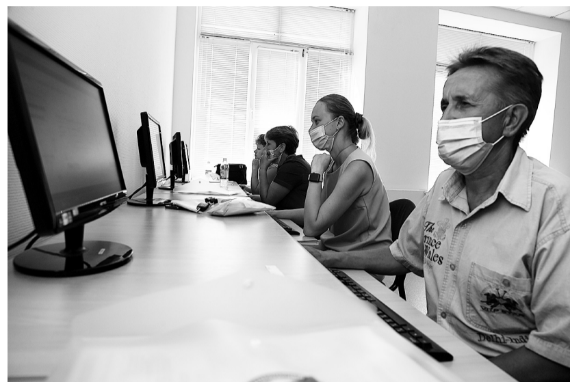
Конкурсанты выполняют тестовые задания.

САМАРСКИЙ АГРАРНЫЙ УНИВЕРСИТЕТ СТАЛ ПЛОЩАДКОЙ РЕГИОНАЛЬНОГО ЭТАПА ВСЕРОССИЙСКОГО КОНКУРСА «ЛУЧШИЙ ПО ПРОФЕССИИ»