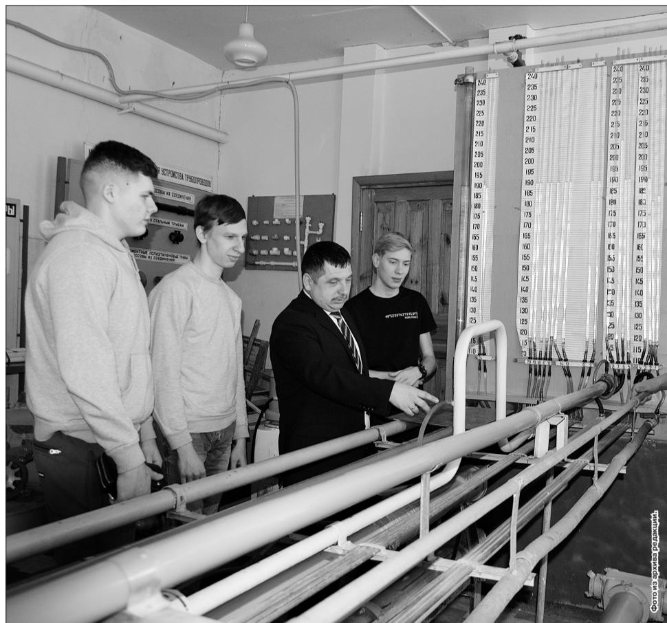
Практические занятия на инженерном факультете Самарского аграрного университета.

торгались, как неизвестная нам «методика» может доставить удовольствие в работе и как достоверен ее результат.