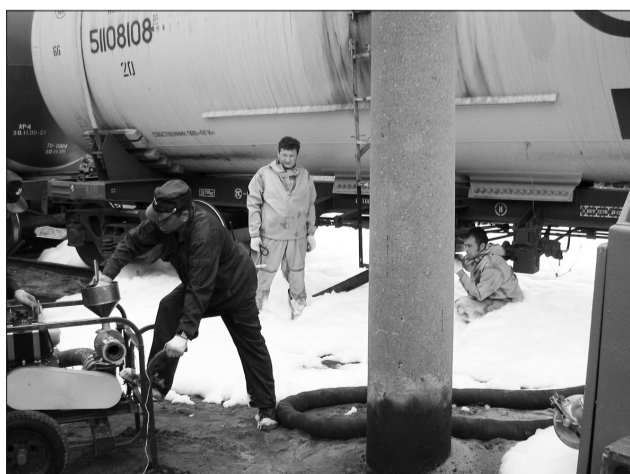
Пожарные ликвидируют протечку опасных веществ путем перекачки из цистерны, применяя пенообразователь.

Пожарный поезд задействуют при пожарах на железной дороге, крушении-