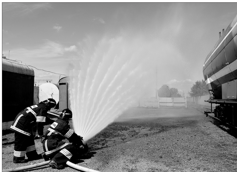
На сколько мощным может быть выброс воды при тушении огня, железнодорожные пожарные продемонстрировали во время познавательной экскурсии. В честь юбилея службы она была проведена для кинельских школьников.

ВОСЕМЬДЕСЯТ ЛЕТ НАЗАД, В 1939-м ГОДУ, НА СТАНЦИИ КИНЕЛЬ БЫЛ СОЗДАН ПОЖАРНЫЙ ПОЕЗД. СЕГОДНЯ ПОДРАЗДЕЛЕНИЕ ВЗАИМОДЕЙСТВУЕТ СО ВСЕМИ СЛУЖБАМИ КИНЕЛЬСКОГО ЖЕЛЕЗНОДОРОЖНОГО УЗЛА