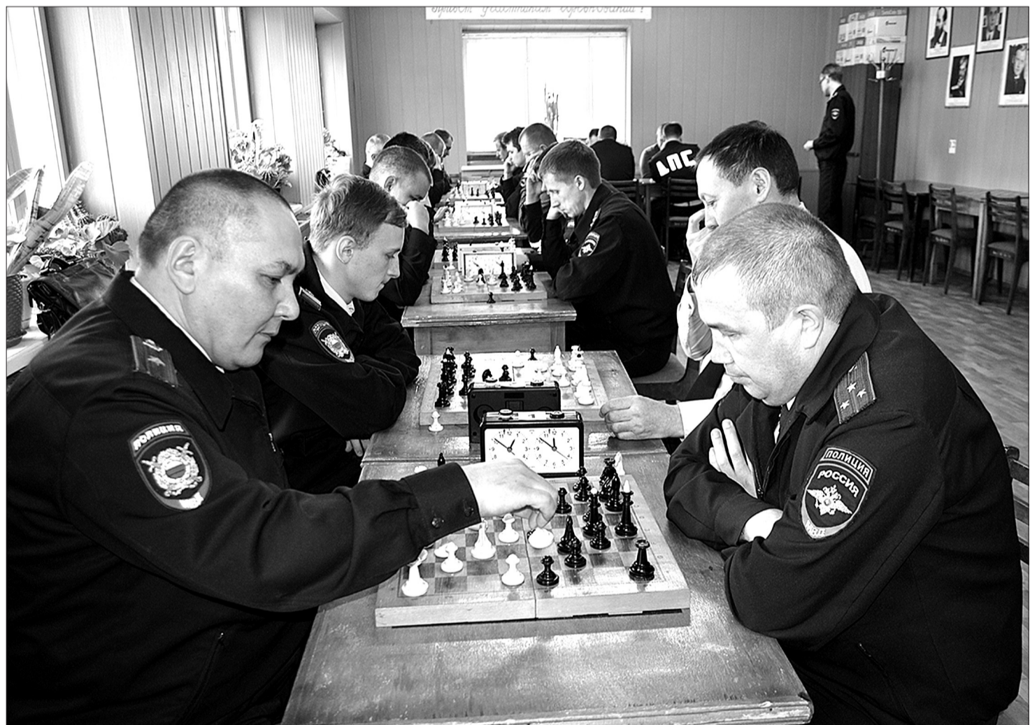
К неслужебному заданию участники состязаний подошли со всей ответственностью.

КИНЕЛЬ ПРИНИМАЛ УЧАСТНИКОВ ОБЛАСТНОЙ СПАРТАКИАДЫ СОТРУДНИКОВ МВД