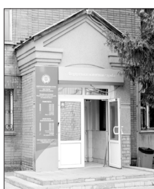
График работы Кинельской Межрайонной ИФНС России № 4 по Самарской области: понедельник, среда - с 9 до 18 часов, вторник, четверг - с 9 до 20 часов, пятница - с 9 часов до 16.45 (без перерыва на обед). В текущем месяце рабочая суббота - 20 апреля, с 10 до 15 часов. Контактные телефоны: 8(84663) 6-10-82, 6-14-54.

Предельный срок подачи декларации - 30 апреля 2019 года - не распространяется на получение налоговых вычетов. В этом случае направить декларацию можно в любое время в течение года.