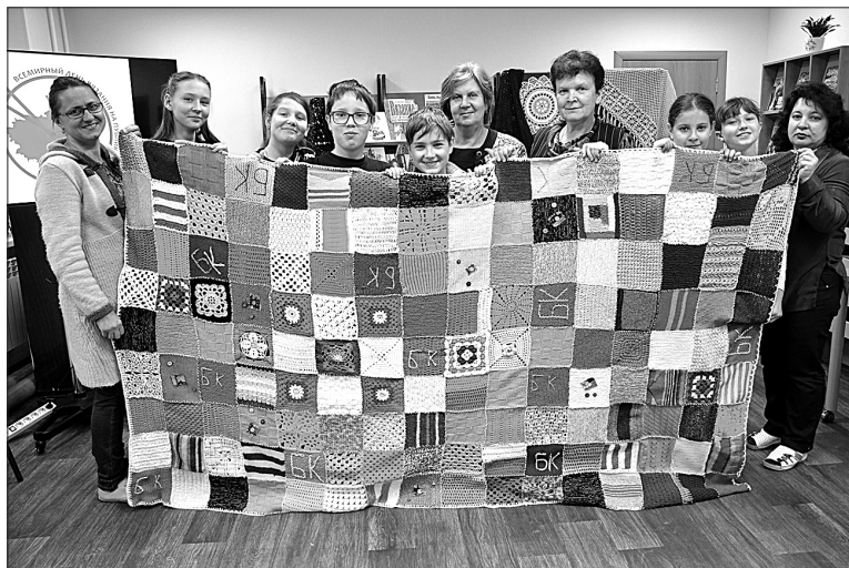
Штучный экземпляр. Нигде больше не найдется плед, похожий на созданный дружной командой.

И вот настало время соединить связанные узоры в плед, и вновь потребовались общие усилия. Над его созданием тру-