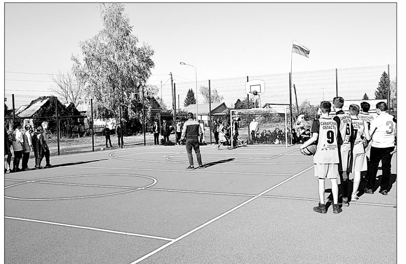
К двум спортивным площадкам, которые функционируют на северной стороне при школах №1 и №3, добавилась еще одна - построенная в жилом микрорайоне.

на участие в «СОдействии» в настоящее время формируются. Кинельцы выходят с предложениями о благоустройстве в следующем году четырех общественных зон.