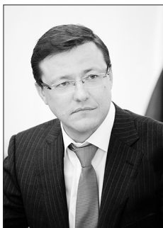
ГУБЕРНАТОР САМАРСКОЙ ОБЛАСТИ Д. И. АЗАРОВ

- Мошенники придумывают бесконечные вариации по отъему денег у населения. Меняют личину, как хамелеоны. С какими видами мошенничества правоохрани-