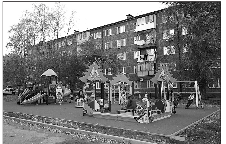
Место для игр есть теперь не только у ребятишек, проживающих в доме №92 по улице Маяковского. Сюда вместе с родителями могут прийти дети из близлежащих домов.

Поддержать инициативных и неравнодушных жителей в их желании благоустроить свой двор, создать зеленые зоны, а также повысить заинтересованность граждан для участия в общественных делах призван губернаторский проект «СОдействие». Он реализуется в рамках программы «Поддержка инициатив населения муниципальных образований в Самарской области». Заявки