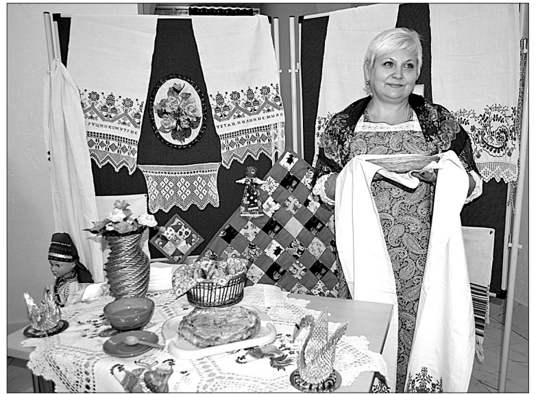
Фестиваль показал все многообразие национальных культур.

Блюда национальной кухни так же старательно подготовили и представили гостям фе-