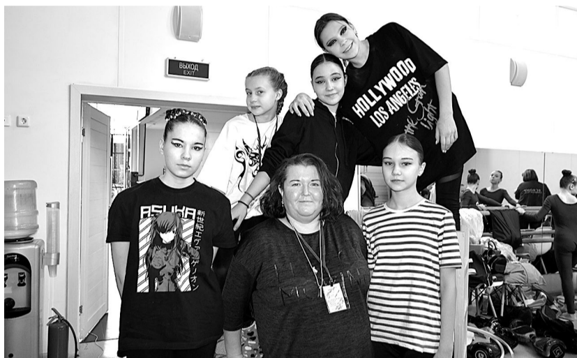
Руководитель Народной цирковой студии «Фантастика» (г. Пермь) старается расширить географию выступлений своих воспитанников.

Мы рассчитываем на дальнейшее сотрудничество с Самарской организацией «ФЕНИКС ГРАНД». Надеемся, этот творческий конкурс станет яркой и зрелищной ежегодной традицией Кинеля.