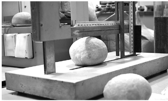
Селекционеры освоили пекарское дело. Ароматная буханка хлеба - часть опытной работы для уточнения показателей качества нового сорта пшеницы.