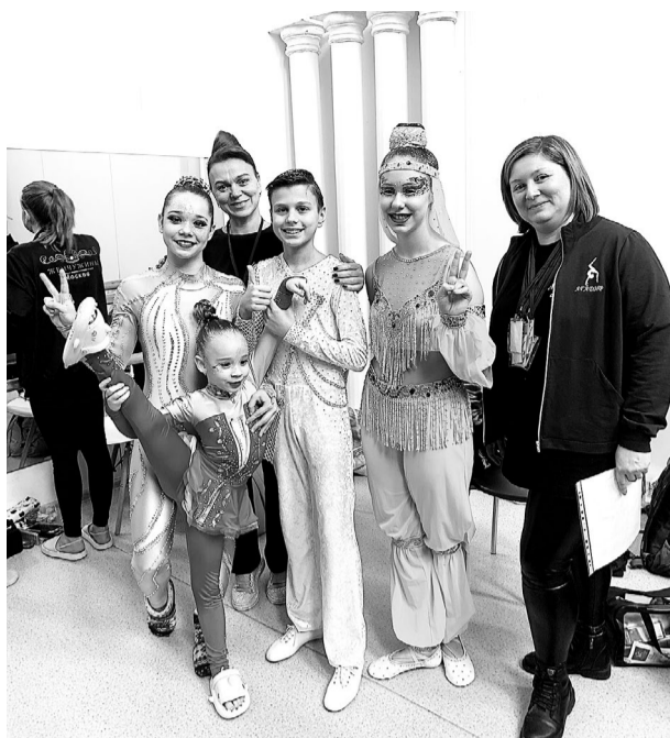
Участники цирковой студии «Агадир» (г. Набережные Челны) признались: выходя на конкурсную сцену, нацеливаются на победу, но теплый отклик зрителей всегда - самая лучшая награда.