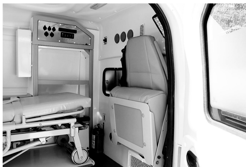
Салон «Нивы» полностью оборудован для оказания медицинской помощи.

Транспорт в медицине играет очень важную роль, прежде всего - это мобильность, уверены водители, которые в этот день получили новые автомобили.