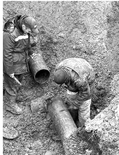
Даже при небольших порывах устранение аварийных ситуаций - процесс трудоемкий.