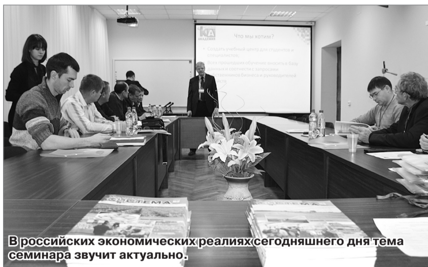
В российских экономических реалиях сегодняшнего дня тема семинара звучит актуально.

В нынешней ситуации, когда перед сельским хозяйством России стоят задачи импортозамещения и решения вопросов продовольственной безопасности, актуальность профессионального ремейка картофельного проекта 90-х и создания новой современной базы для обучения специалистов по выращиванию «второго хлеба» выросла в разы. Поэтому сельскохозяйственная академия совместно с компанией «Солано-Агро» приступила к реализации этого большого проекта, который впервые был проанонсирован на «Неделе мирового агробизнеса» в марте этого года. В рамках «Картофельной академии» в августе прошел День картофельного поля, а уже в сентябре этот