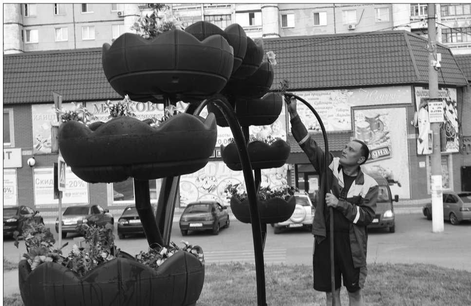
Алексеевка. Работник коммунальной службы поливает цветы в вазонах, установленных в центре поселка.

моментам учились на собственных ошибках. Так как уход за цветочными клумбами очень трудоемок, требует большой заботы, решено акцент сделать на подвесных кашпо, в них яркие цветочные пятна сконцентрированы и не теряются из вида. Да и выглядят современно. Упрощается уход, начиная с посадки, и далее - по прополке, поливу. Чтобы цветы радовали продолжительным цветением, работники осуществляют ежедневный полив. А здесь проблема - нет специализированной техники - машины-лейки. Используем две водовозки, поливаем из шланга, такой метод - трудозатратный. Пока не решены вопросы регулярного полива, пришлось отказаться от газона по улице Маяковского. Без системы автоматического полива это пустая затея.