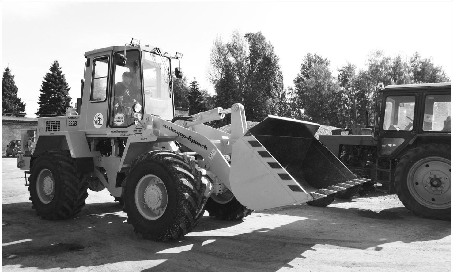
На производственной базе муниципального предприятия «СБСК» идет обкатка приобретенного фронтального автопогрузчика «Амкодор».

ЧТОБЫ РАБОТА КОММУНАЛЬНОЙ СЛУЖБЫ БЫЛА ЭФФЕКТИВНОЙ, НЕОБХОДИМО РАЗВИВАТЬСЯ, ПРИМЕНЯТЬ НОВЫЕ ТЕХНОЛОГИИ