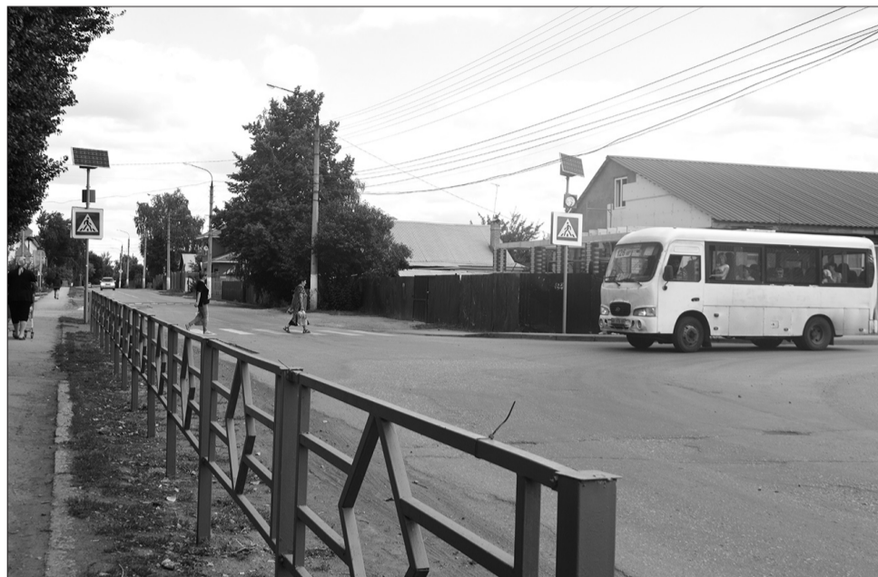
Светофор на солнечных батареях установлен на перекрестке улиц Украинская и 50 лет Октября.