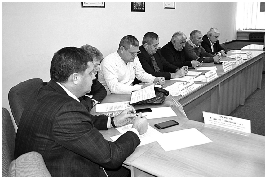
В разговоре с руководителями предприятий, обслуживающих жилой фонд, депутаты постарались разобраться в вопросах, которые возникают в работе управляющих компаний.

Разбирались ситуации общего характера. Программа по ветхим и аварийным домам в стране работает десять лет, но острота проблемы не снижается, а наоборот - усиливается. Жилой фонд стремительно стареет, на балансе УК скапливается все больше таких домов, их содержание становится все дороже. Другой серьезный вопрос - сорваны графики капитального ремонта.