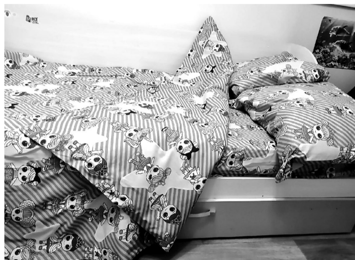
Довольные клиенты благодарят предпринимателя за качество изделий, яркость которых поднимает настроение, оперативность выполнения заказа. И обещают «вернуться» за покупками.