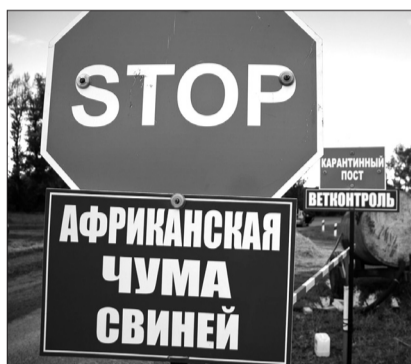
В 2017 и 2018 годах АЧС была выявлена в Красноармейском и Хворостянском районах.

поголовье в ветеринарной службе городского округа Кинель;