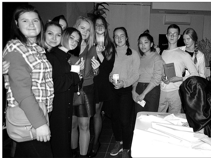
Квест-игра по мотивам известного романа Михаила Булгакова заинтриговала.

ку!». Это здорово. Марианна - волшебница. И очень приятно, что есть возможность к этому волшебству прикоснуться в «Ночь искусств».