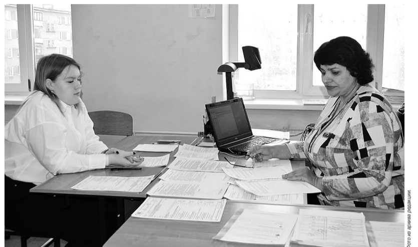
Допуск к Основному государственному экзамену учащиеся девятих классов получают по итогам собеседования по русскому языку. Предэкзаменационное испытание ребята проходят в своих школах.

У выпускников девятих классов итоговая аттестация начнется 21 мая