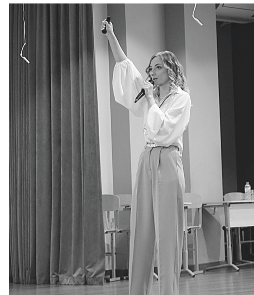
Мастер-класс педагога на тему «Что же такое мы».