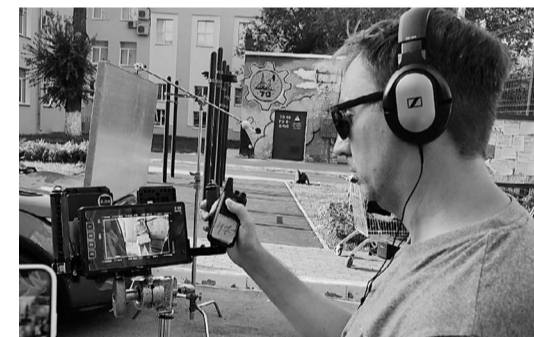
На съемках сериала «Цирк!» (16+)

Кроме того, создается кинокомиссия, в круг ее задач входят вопросы, связанные с предоставлением субсидий на компенсацию части расходов компаниям, которые будут снимать кино в Самарской области. Также в зоне ответственности комиссии - вопросы по развитию киноиндустрии в регионе.