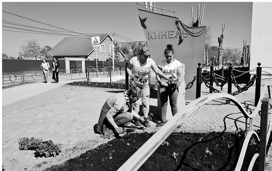
В теплое время городские парки и скверы, места отдыха украшают цветочные клумбы. Эти работы по благоустройству также выполняют специалисты СБСК.

ливать надо все больше. Автополив - палочка-выручалочка, но он далеко не везде. Производится в зеленых зонах на озерах Ладное и Крымское, на части газонов на студенческих аллеях в Усть-Кинельском.