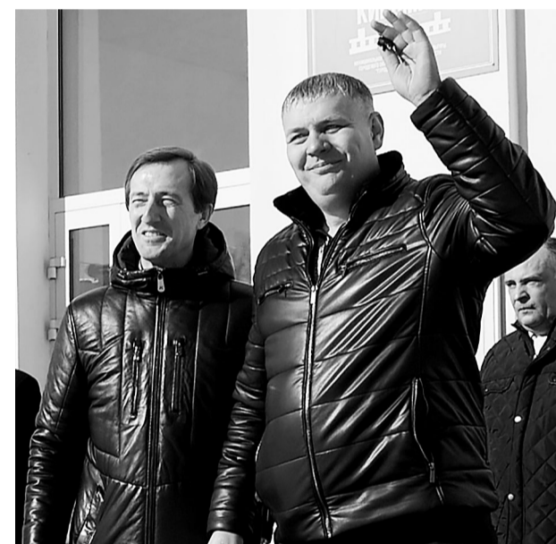
Для водителей муниципального транспорта полученная техника - настоящий подарок. Работать на новых автобусах для профессионалов ответственно, но и приятно.