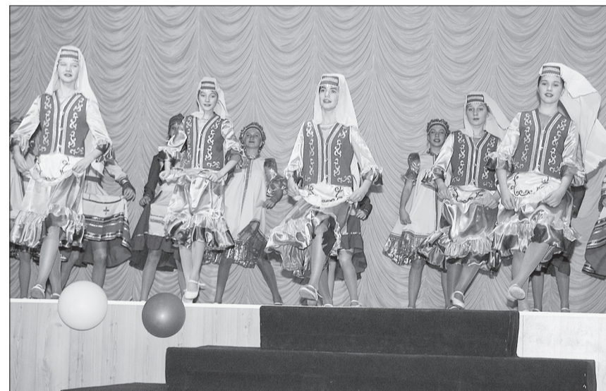
Лауреатами фестиваля стали учащиеся Образовательного центра «Лидер» за красочный танец «Венок Поволжья».

до велика. Фантазии выступающих можно только позавидовать. Рассказы о народностях сопровождаются электронными презентациями, красочными видеоматериалами, стихотворениями и творческими номерами.