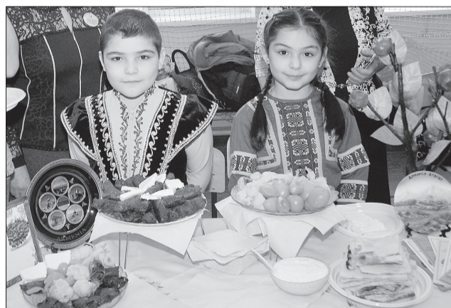
Юные участники фестиваля подарили частицу гостеприимной Армении.

Праздник дружбы и единства народов в Образовательном центре «Лидер» как всегда прошел шумно, красочно, интересно. В этом году свою активность представители образовательных учреждений показали, как никогда раньше. В списке участников - рекордное количество организаций: 35 школ и детских садов городского округа Кинель и Кинельского района.