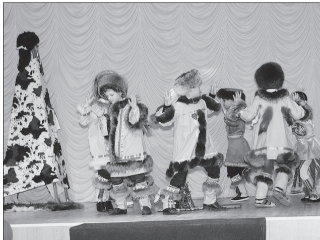
Якуты из школы № 2 поселка Усть-Кинельский заслужили особой оценки.

Обычаи и традиции двадцати национальностей были представлены на шестом окружном фестивале «Народы Самарской губернии»