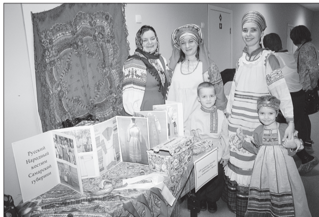
В деталях представили русский национальный костюм педагоги и воспитанники детского сада «Тополек» из Алексеевки.