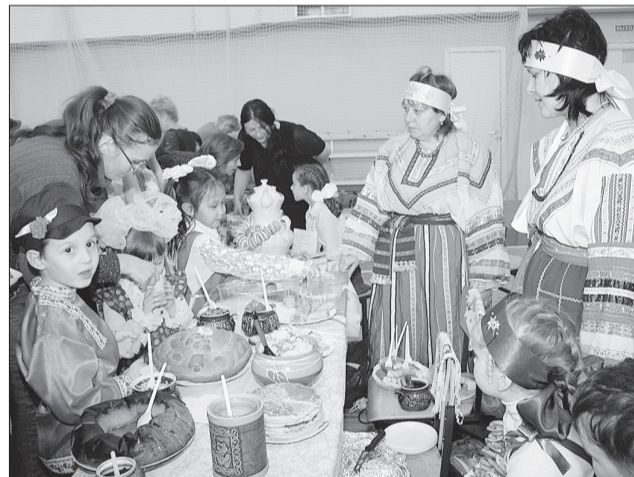
С национальной кухней не только знакомили, но и от души угощали участников мероприятия.