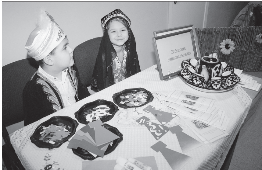
О традициях и костюмах солнечного Узбекистана рассказывали воспитанники детского сада «Солнышко».

«Этнографическая площадка» на фестивале считается по праву самой интеллектуальной. Здесь за победу борются участники от мала