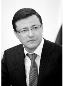
ГУБЕРНАТОР САМАРСКОЙ ОБЛАСТИ Д. И. АЗАРОВ