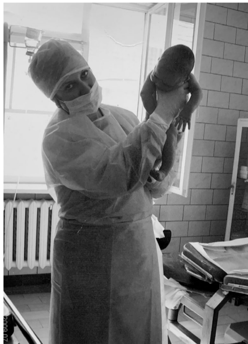
На руках Натальи Викторовны - новая жизнь. Чудо прихода в мир маленького человека не перестает ее удивлять и радовать.

ПОСТАНОВЛЕНИЕ Администрации городского округа Кинель от 26.02.2024 года №526