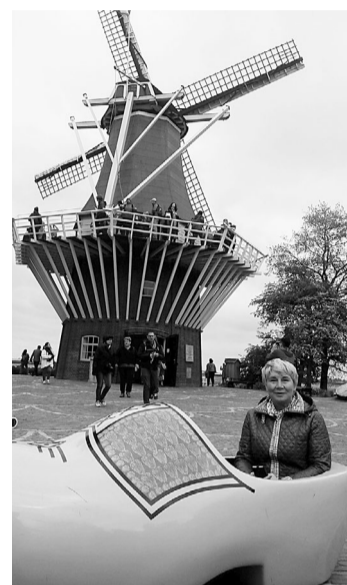
Голландия ее впечатлила ветряными мельницами.